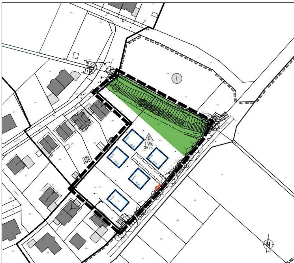
Geltungsbereich der 4. Erweiterung der Innenbereichssatzung Geber