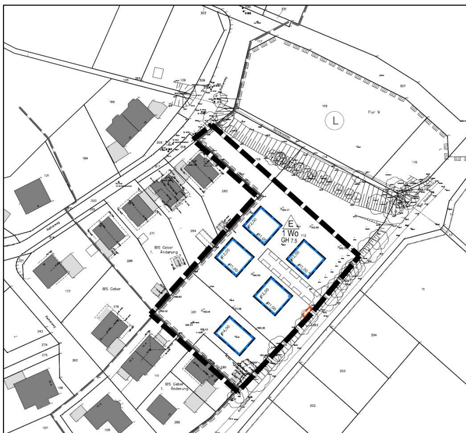
Geltungsbereich der 4. Erweiterung der Innenbereichssatzung Geber