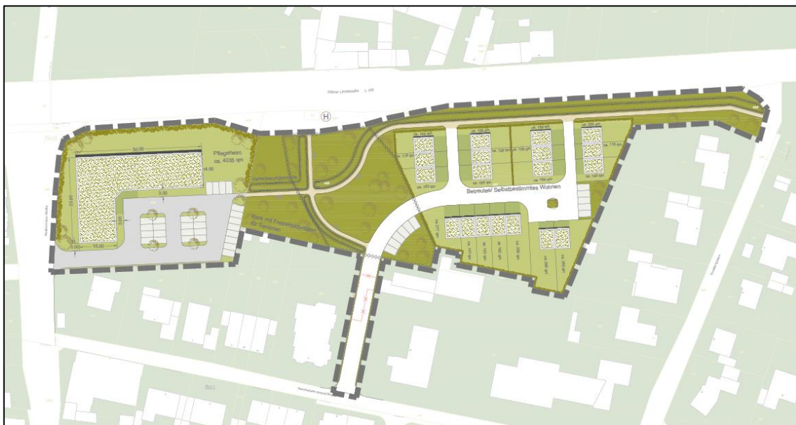
Abb. 3: Entwurf eines vorläufigen Gestaltungsplans (VDH).

Auf der Planfläche befinden sich derzeit ausschließlich Pferdeweiden. Im Norden verläuft die Kölner Landstraße, im Westen liegt die Zufahrt zur südlich angrenzenden Bebauung. Im Osten grenzen die bestockten Gärten der dortigen Bebauung an. Die Zufahrt soll von Süden durch eine Baulücke erfolgen. Die Planung sieht die Errichtung mehrerer Gebäude sowie die Anlage von Parkplätzen und eines kleinen Parks vor.