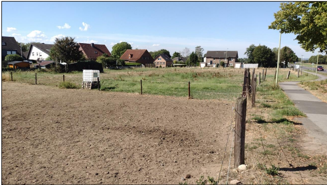
Abb. 4: Blick von Westen auf den Garten mit 4 Walnussbäumen.

Am 01.09.2022 fand eine Begehung der Planfläche statt. Die gesamte Fläche wird von Pferdekoppeln eingenommen. Es stocken keinerlei Gehölze auf der Fläche; nur ein kleiner Schuppen existiert. In den umliegenden Gärten stocken einige Einzelbäume minderer Qualität und im Osten sind die Gärten dicht mit Gehölzen (zum Großteil Koniferen) bestockt. Auf der Fläche ist ein Vorkommen planungsrelevanter Arten von vorneherein auszuschließen. Und auch im unmittelbaren Umfeld ist das Potential extrem gering.