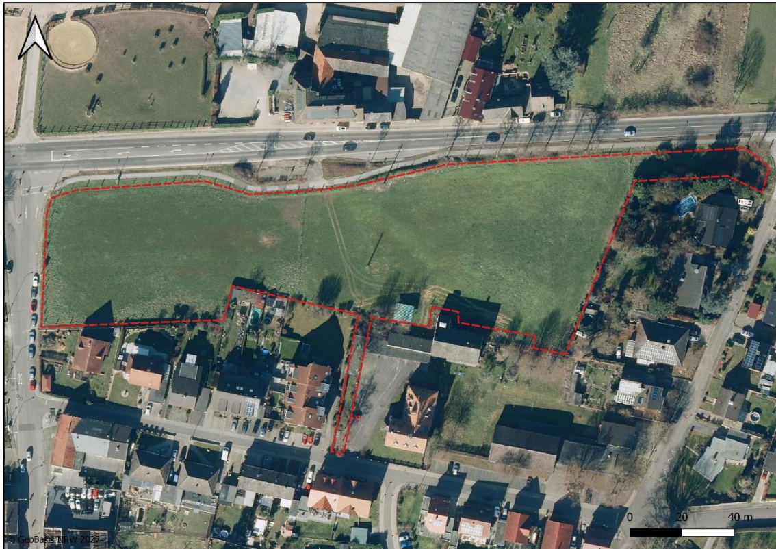
Abb. 2: Lage im Luftbild mit Pferdeweiden und der umliegenden Bebauung.

Auf der Planfläche befinden sich derzeit ausschließlich Pferdeweiden. Im Norden verläuft die Kölner Landstraße, im Westen liegt die Zufahrt zur südlich angrenzenden Bebauung. Im Osten grenzen die bestockten Gärten der dortigen Bebauung an. Die Zufahrt soll von Süden durch eine Baulücke erfolgen. Die Planung sieht die Errichtung mehrerer Gebäude sowie die Anlage von Parkplätzen und eines kleinen Parks vor.