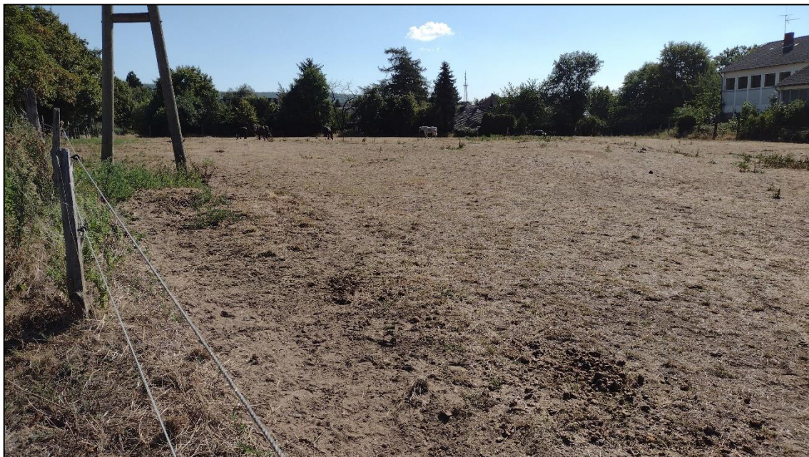
Abb. 5: Randstrukturen nach Norden.