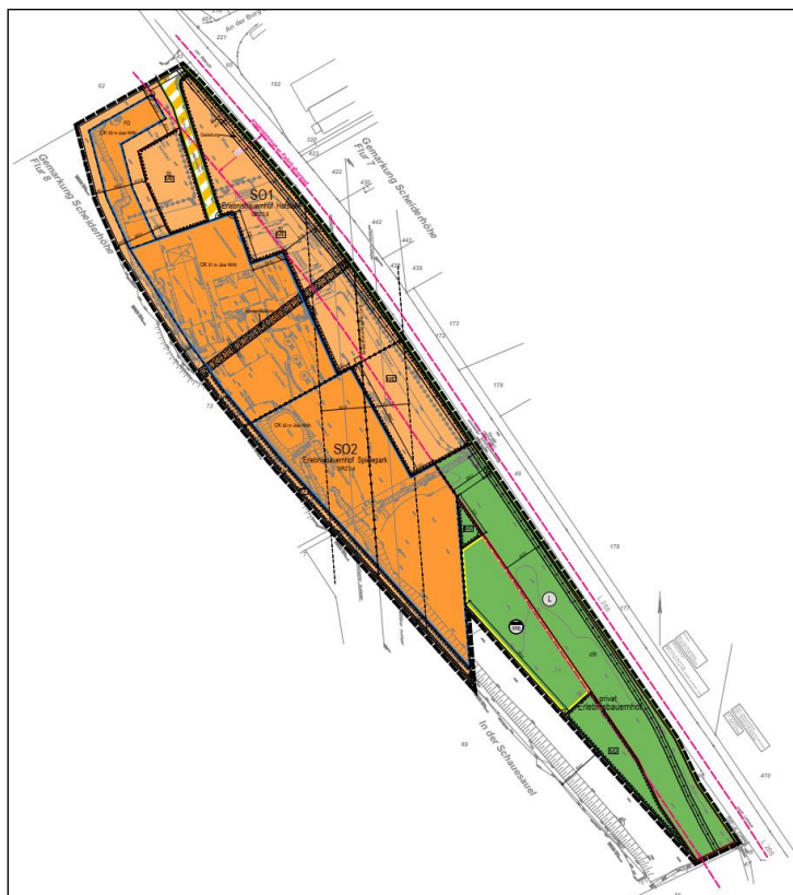
Geltungsbereich des Bebauungsplanes Nr. 76.1 „Erlebnisbauernhof Krewelshof“