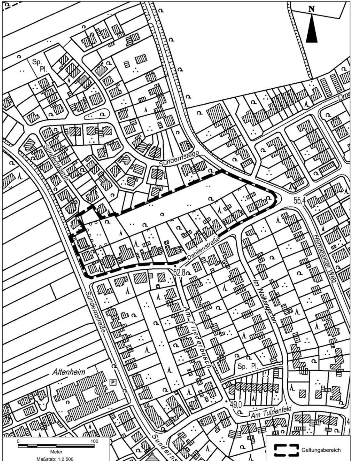
Auszug aus der Amtlichen Basis Karte zum Bebauungsplan Nr. 103 "Dahlienstraße" der Stadt Haltern am See, im Ortsteil Haltern - Mitte