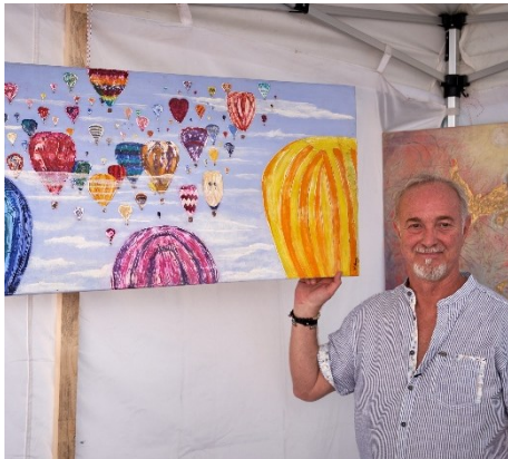
Leisten zur Verstärkung