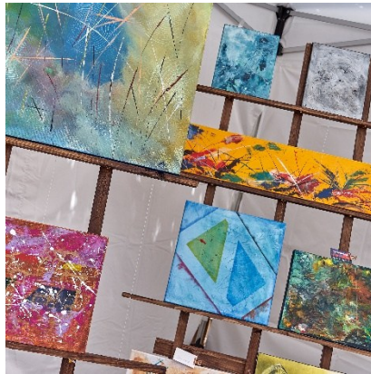
Eigene Gestell Konstruktion